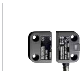
BNS 260 - Codice: C-71BNS2