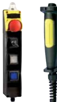
Codice: BDF 200 / C-78ZSD