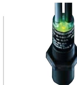
CSS 180 - Codice: C-22CSS1