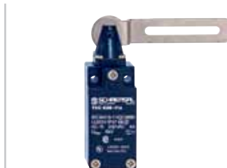
T.C 235/236 - Codice: C-53TC23