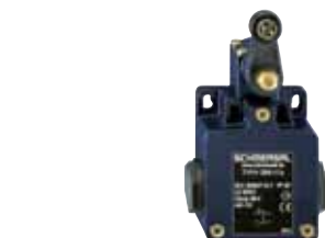
Z/T 255 - Codice: C-07255