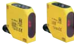
SLB 400 - Codice: C-86SLB4