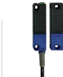
RSS 36 - Codice: C-57RSS3