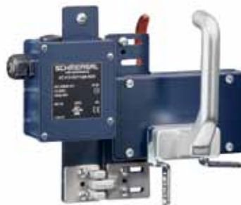
AZ 415 - Codice: C-16AZ41