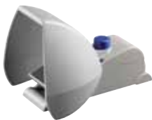
TFH 232 - Codice: C-64TFH2