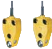
SLB 200 - Codice: C-43SLB2