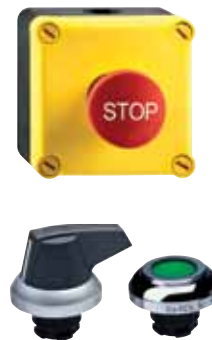
Codice: Dispositivi di comando e segnalazione