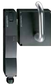
AZM 200 - Codice: C-24AZM2