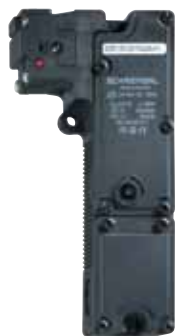
AZM 190 - Codice: C-04AZM1