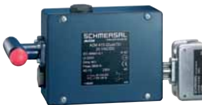
AZM 415 - Codice: C-23AZM4