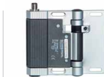
TVS 410 - Codice: C-56TVS4