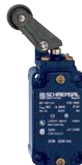
Z/T 335/336 - Codice: C-12335