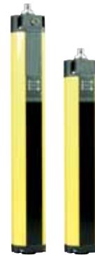
SLC 421 - Codice: C-21SLC4