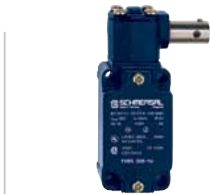
TV.S 335 - Codice: C-34TV8S