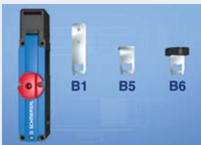
所有安装情况下的操动件 B1（直式操动件），B5（弯角操动件）， B6（可调操动件）