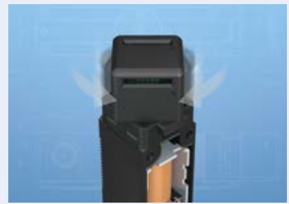
旋转操动头 操动头无需松开螺钉即可旋转