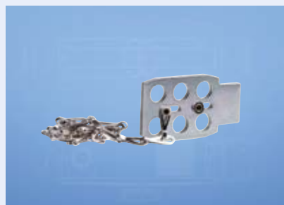
停工上锁标签SZ150-1 防止意外关闭，例如在维修时