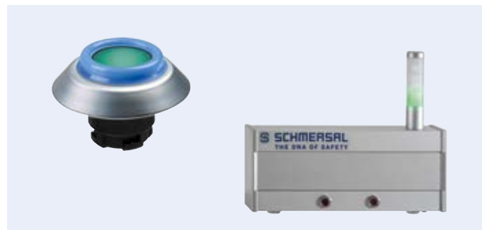
Hygienegerecht: die Befehlsgeräte aus dem N-Programm von Schmersal.