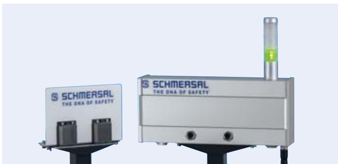
Kernelemente des Systems: eine Meldeleuchte (grün/gelb/rot) mit Summer sowie ein Sicherheitsbaustein der PROTECT SRB-E Familie.

Zur nutzerfreundlichen Bedienung des Systems wurden Befehlsgeräte aus dem N-Programm von Schmersal verbaut. Diese sind hygienegerecht und lassen sich gut reinigen.