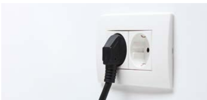
Für die einfache Installation wird lediglich eine herkömmliche 230-V-Steckdose benötigt.