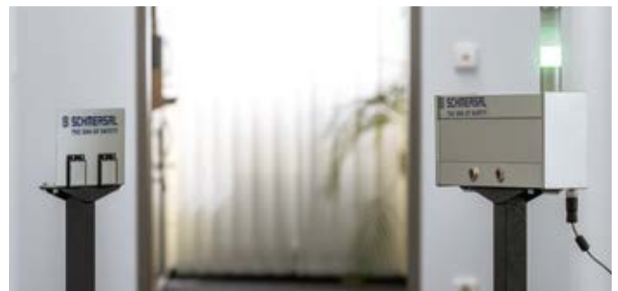
Das Zutrittskontrollsystem kann bis zu 20 Personen zählen.