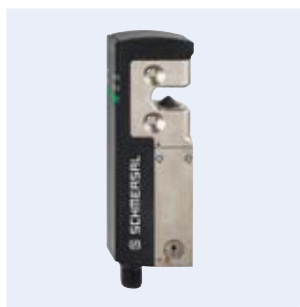
AZM40 Encravamento de segurança