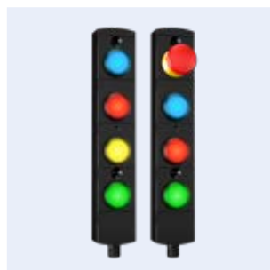
BDF40 Painel de operação com ou sem PARAGEM DE EMERGÊNCIA