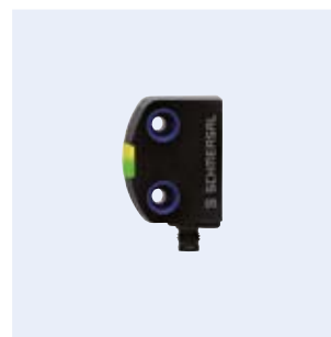
RSS260 Sensor de segurança